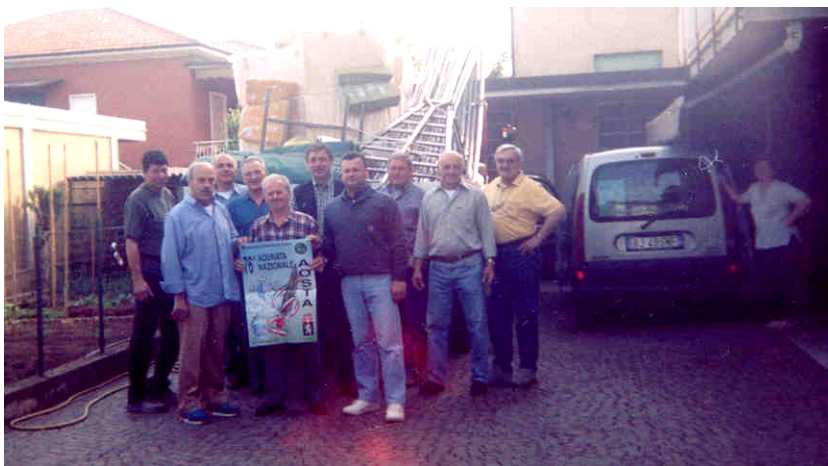
I CAVALIERI ERRANTI PARTONO!!!!!!!

Manovre di carico del camion presso la reggia di re Artù in quel di villa “Oliva” e rimessaggio dello stesso nel maniero di ser Bosium.