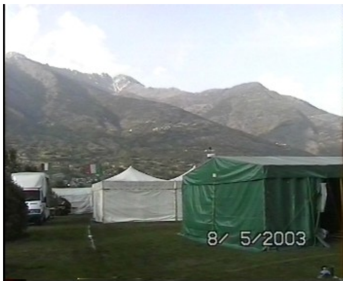
l'accampamento nel ducato di Pollein

Dopo aver attraversato ducati e feudi della Lombardia e del Piemonte ecco all’orizzonte comparire la città di Aosta, a questo punto re Artù decide di accamparsi alla periferia della stessa, onde evitare subito uno scontro diretto, ma studiarne con tutta calma la strategia di assedio ed accerchiamento.