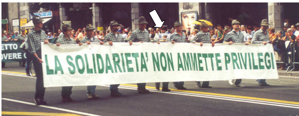
Osservate attentamente....dieci paia di gambe....nove teste!!!

Impossibile, mistero....., di chi era la testa mancante, quale intrigo!!!!!!