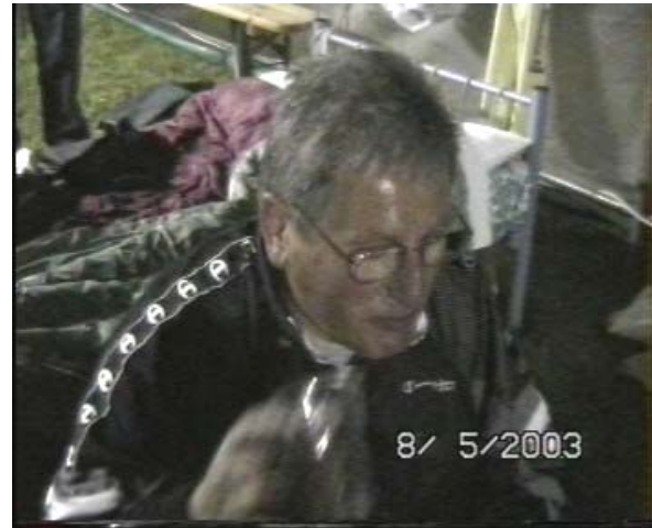
ecco l'uomo dai mille perché??? Ser Trolium ed il nostro cavaliere delle relazioni pubbliche mentre si stà rinfrescando l'ugola ser l'Ancillotto.