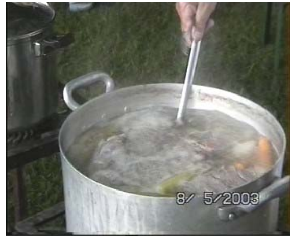
ser Forzellan alle prese con la gran "Bollituram"

Bollituram" della quale ser Jannes ne va pazzo