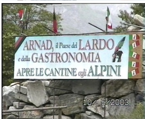
Il saluto dell'Autore al lardo...

"È con immensa gioia ed orgoglio che saluto questa città, Aosta, città cordiale ed ospitale, città con una cultura millenaria e montanara.