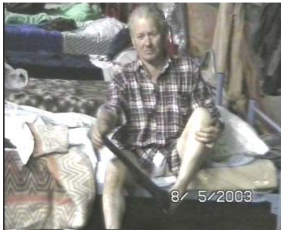
prima operazione, si tolgono le braghe ed i calzari!!!!!!!!!!!!!!