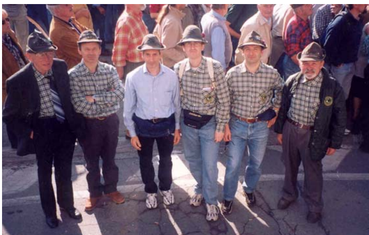
Le possenti spalle di re Artù!!!!!!!

Attimo di panico nello sguardo di re Artù, appena giunto nel luogo detto "Ammassamento", dopo aver depositato il pesante striscione a terra, dopo essersi rifocillato con gli amici ritrovati, un urlo fece sobbalzare i suoi cavalieri: < lo striscione era sparito, svanito nel nulla >