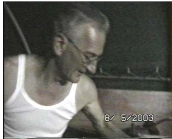
Ed infine ecco quel fisico bestiale del nostro grande capo re Artù, notate non abbandona un istante la sua armatura se la porta anche quando dorme!!!!!!!!!!!!

Ecco Parsifal il cui pensiero di donna Ginevra lo accompagna sempre anche a letto!!!!!!!!!!!!