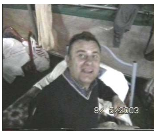
terza operazione, il cavaliere in tutta la sua possanza mentre si corica sul suo giaciglio e con l'ausilio del fedele scudiero ser Maximilian attende dallo stesso il bacino della Buona Notte prima di addormentarsi definitivamente!!!!!!!!!!!!!!