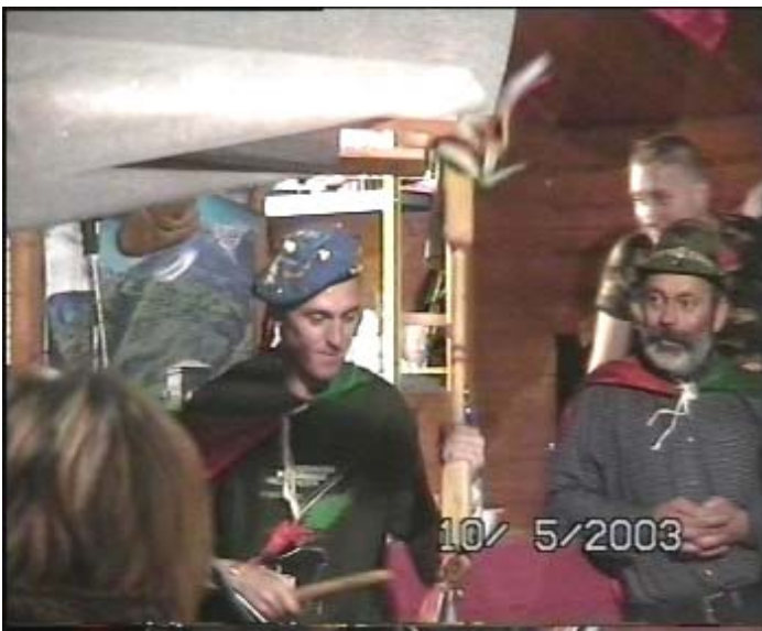
il musico con il suo bastone!!!!

Al nostro ingresso la tenda improvvisamente si anima, entrano dei musicisti con degli strumenti a noi sconosciuti, che i villani del posto chiamavano “fisarmoniche e chitarre!!!, uno addirittura percuoteva un lungo bastone!!!!”, ed iniziano a suonare strane melodie ma note anche alle nostre terre, alle nostre uogle. Un’occhiata di re Artù a ser l’Ancillotto il quale da uomo di pubbliche relazioni intuisce il da farsi, sparisce per poi ricomparire portando dei “ grossi ” calici contenenti una bevanda a noi