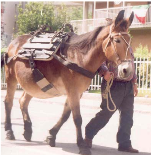
il veloce destriero di ser Vajenten!!!!!!

Siamo preoccupati per ser Vajenten, riuscirà ad uscirne vivo? Il cielo diventa sempre più nero, le forze del male non vogliono che la nostra ricerca debba terminare con esito positivo, si scatena l'inferno!!!