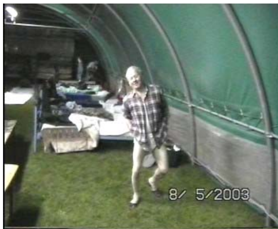
seconda operazione, una sistematina al dispositivo "Reggi Ballorum" ed ecco il cavaliere svestito!!!!!!!!!!!!!!