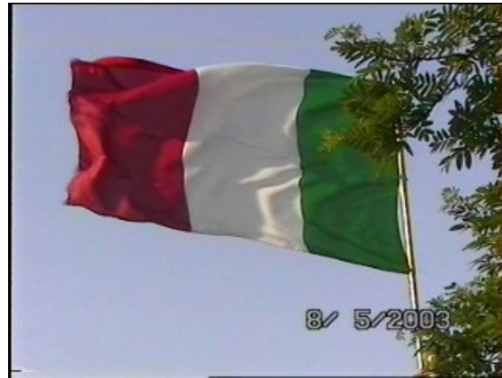
il Tendone e la nostra Bandiera

Comunque anche durante l'installazione dell'accampamento un pensiero domina la mente dei cavalieri; dove sarà la “Doccia” .