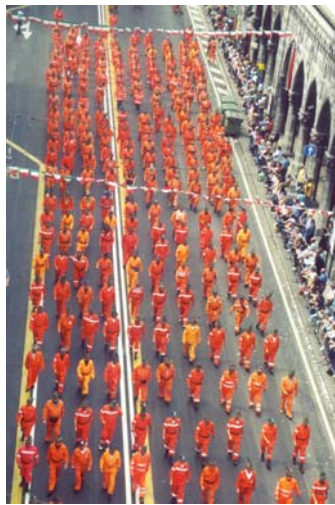
La Nostra Protezione Civile

Ammassamento non è solo un punto di ritrovo ma anche un luogo dove si incontrano amici provenienti da altre sezioni, da altre regioni, un luogo di riposo (quanti di voi riescono a dormire in piedi provate a chiederlo al Gianni ), un luogo tremendo, tormentato e con un caldo infernale, eppure qualcuno stringeva tra le mani un ombrello ed un trapuntino, che temerario il Rain Man ... I nostri quattro giovani sono ancora traumatizzati da questa esperienza, non importa si abitueranno al clima di Alcatraz..... Per fortuna erano presenti gli uomini della protezione civile (anche i nostri) sempre all'erta e pronti, questo ci rendeva più tranquilli.