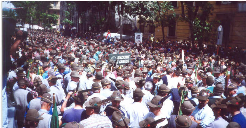
Panoramica dell'ammassamento della nostra Sezione.....