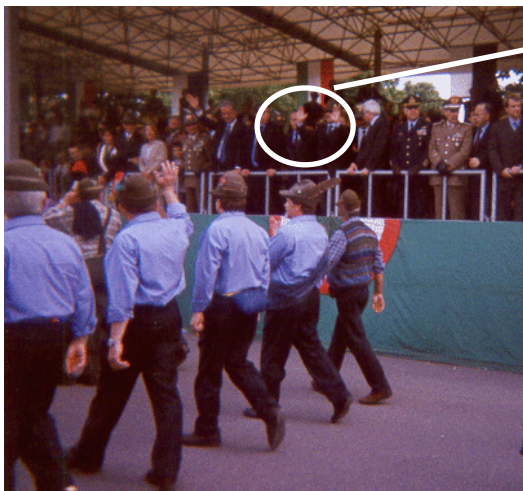
La Tribuna d'Onore