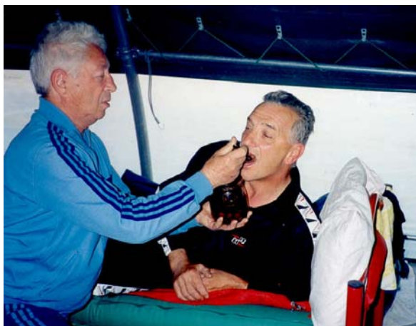
Colazione in camera.....

Chi l'avrebbe mai pensato!. Ogni mattina puntualmente (ore7.00) venivamo svegliati con il suono festoso delle campane..... , era come avere la sveglia in camera attraverso il centralino dell'albergo!!