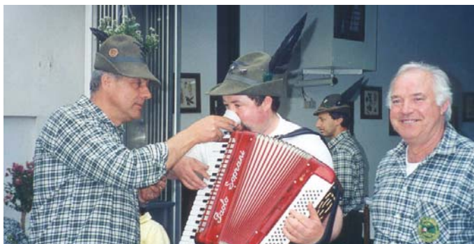
Gli angeli custodi del Cantastorie ....ed il crollo