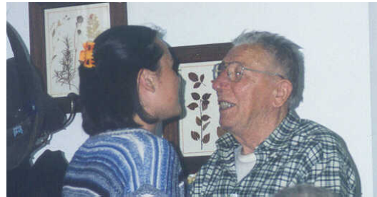
Il gagliardetto e la ricompensa dell'Arturo.....