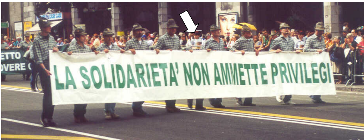
Osservate attentamente....dieci paia di gambe....nove teste!!!

Ma..., mistero....., di chi era la testa mancante, quale intrigo!!!!.