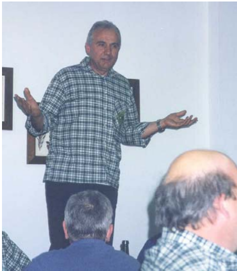
L'Autore al meeting degli scrittori.....

"È con immensa gioia ed orgoglio che saluto la città di Genova, città cordiale ed ospitale, città con una cultura millenaria e marittima, intreccio di molteplici culture. All'interno di questo clima, radicato nella vostra città, ha trovato il giusto posto anche il nostro Tendone espressione del vivere quotidiano, espressione di amicizia anche tra persone con culture diverse. Tendone che accomuna, che ci rende solidali che per un attimo ci fa comprendere quanto è bello poter vivere con poco, quasi niente. In cambio però ci offre molto, ci fa riscoprire il gusto di stare in compagnia, di conoscere e stare a contatto anche con le persone anziane e di vederle sorridere felici con noi. Ed è con questa ricca esperienza che abbiamo caricato il nostro Tendone, lo riporremo nel nostro magazzino, ma nel nostro cuore sarà sempre vigile e presente a farci ricordare questi valori indistruttibili.