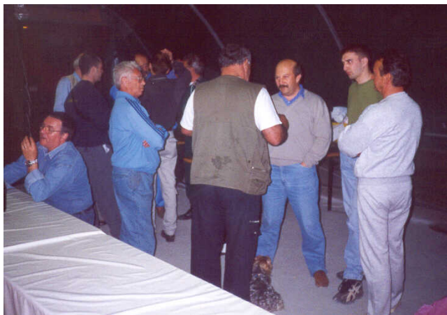
La stanchezza dei nostri cuochi.....