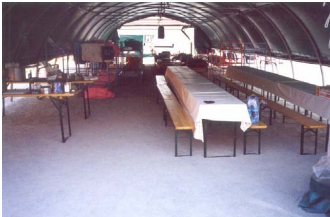
Panoramica del nostro Tendone