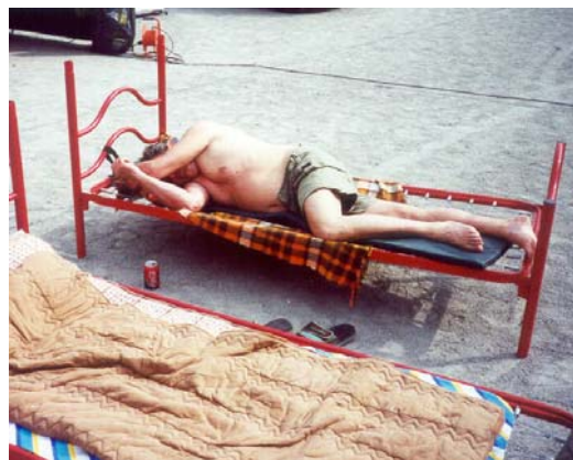
Le lucertole da sinistra verso destra: Ottorino, Luciano e le due posizioni del Silvano