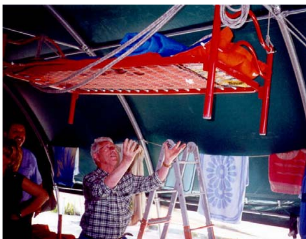
Eppur si muove....