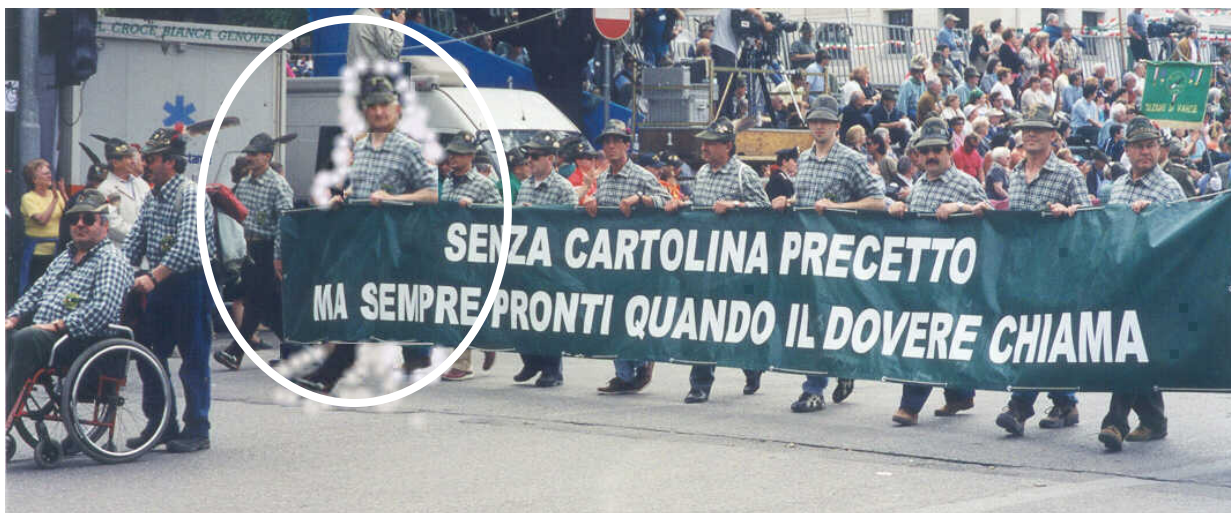
Il passo della lunga e ondeggiante Ombra...è veramente lunga....!!!