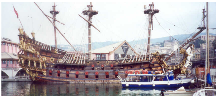
Il Galeone di Tinto ....

Anche quest'anno il nostro capo Tendone, conoscendo molto bene la nostra sete di conoscenza , aveva organizzato una giornata culturale con visita alla Cattedrale, al Palazzo Ducale, all'Acquario, al Museo Navale e al galeone corsaro!!!!!!.