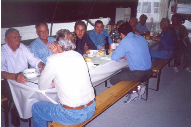
L'ultima tranquilla cena dei dodici.....